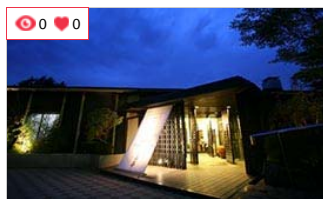
雅芳婷仙石亭酒店