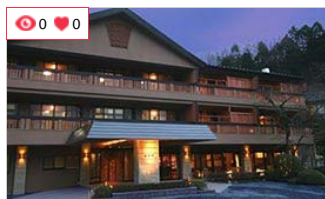
仙乡楼别邸·奥之树树