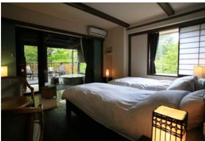
雅芳婷仙石亭酒店

雅芳婷仙石亭酒店整栋住宿的设计概念为“回归自我”。坐落在日本保有原始风景至今仍留存的仙石原中，被自然环抱的这间客栈里，全部客室都备有露天浴池。因此每一位房客都可以随意享受到泡汤的乐趣。此外美味的法式盛宴、有机植物的FONTAINE BLEAU原创化妆品及FONTAINE BLEAU SPA服务等，让你能够得到身体上的放松和满足。是一个再远也要去“追求真实”的地方。