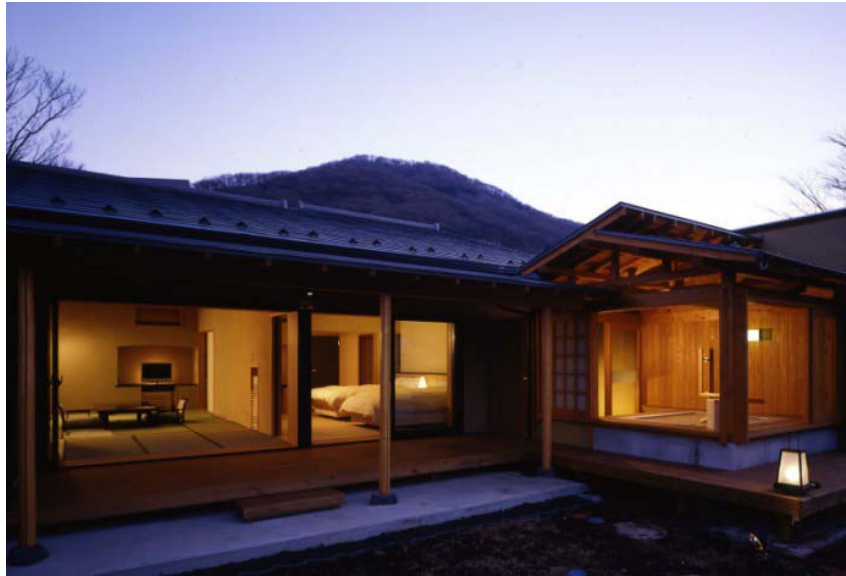
仙乡楼 别邸·奥之树树

在约15000平方米的广阔土地上，悄然伫立着一座日式旅馆。这座日式旅馆环抱葱郁树木，伴随小鸟高歌，和美阳光。仙乡楼的特别楼层“别邸·奥之树树”设置了100平米的独立客房。全都附有天然源泉挂流的露天浴池。满是绿意语花香，没有世俗的束缚，享受一个个惬意的早晨，雍容的午后，还有浪漫的夜晚。