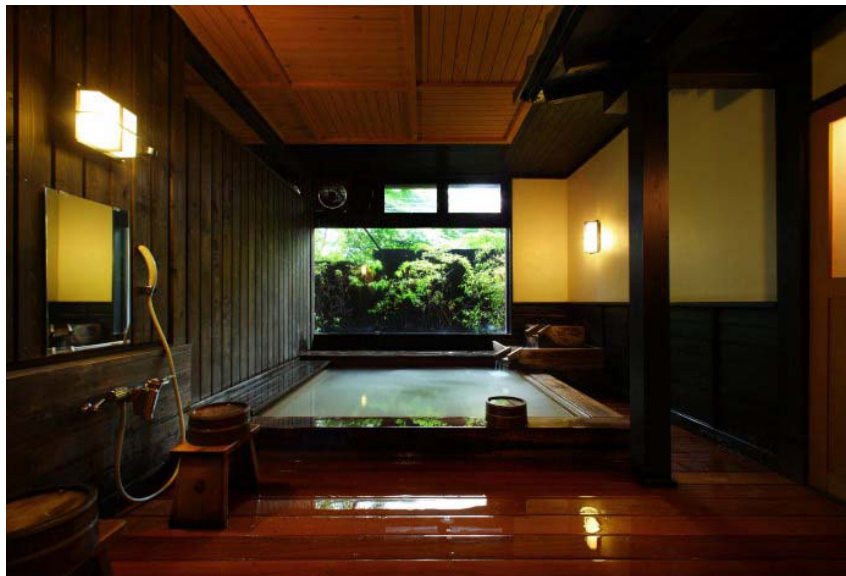
雅芳婷仙石亭酒店

雅芳婷仙石亭酒店整栋住宿的设计概念为“回归自我”。坐落在日本保有原始风景至今仍留存的仙石原中，被自然环抱的这间客栈里，全部客房都备有露天浴池。因此每一位房客都可以随意享受到泡汤的乐趣。此外美味的法式盛宴、有机植物的FONTAINE BLEAU原创化妆品及FONTAINE BLEAU SPA服务等，让你能够得到身体上的放松和满足。是一个再远也要去“追求真实”的地方。